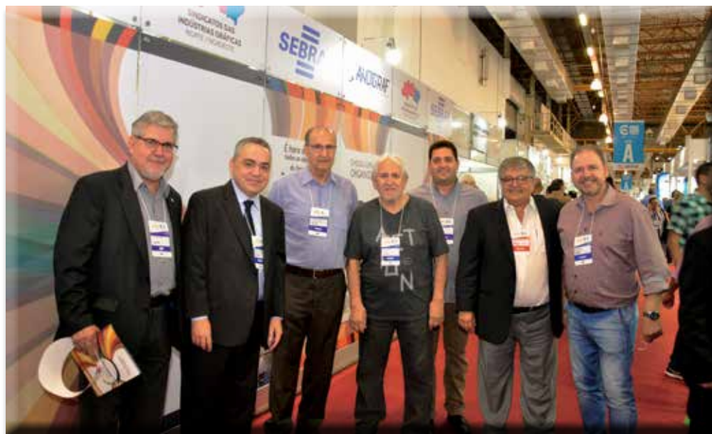
Entidades e fornecedores somaram forças às empresas gráficas na fundação da ANDIGRAF

O apelo sustentável esteve por toda a feira, com aplicações que focam na economia de custos e no impacto zero ao meio ambiente.