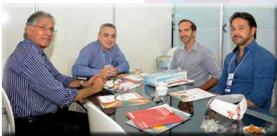
A ExpoPrint oportunizou momento especial para apresentar ANDIGRAF